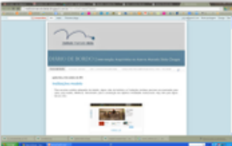
Blog Diário de Bordo

A Descrição Arquivística do arquivo pessoal será principalmente disponibilizado pela web, na base IMD AtoM , open source fornecida pelo CIA – International Council of Archives, órgão vinculado à UNESCO e ao CoE.