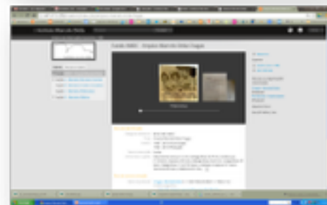
Sistema de Informações Arquivísticas ICA-AtoM